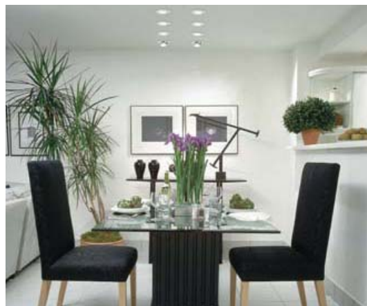
Focos de fibra iluminando mesa de comedor