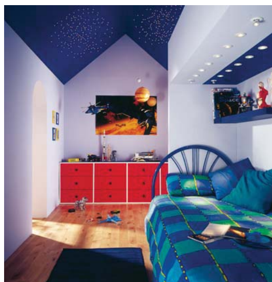
Cielo estrellado Focos de fibra encima de la cama