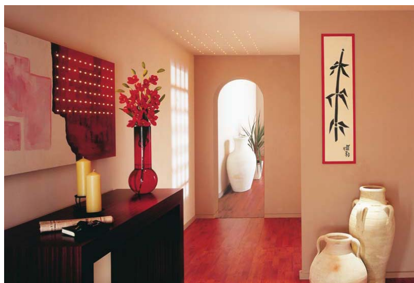
Recibidor con matriz de fibra en el techo Cuadro con fibra óptica

La fibra óptica es también uno de los métodos más seguros para la iluminación de cocinas y baños. La ausencia de electricidad en el punto de luz permite su instalación en lugares propensos al contacto con el agua. El que se trate de una luz fría nos proporciona una seguridad extra cuando esta luminaria se encuentra al alcance de los niños